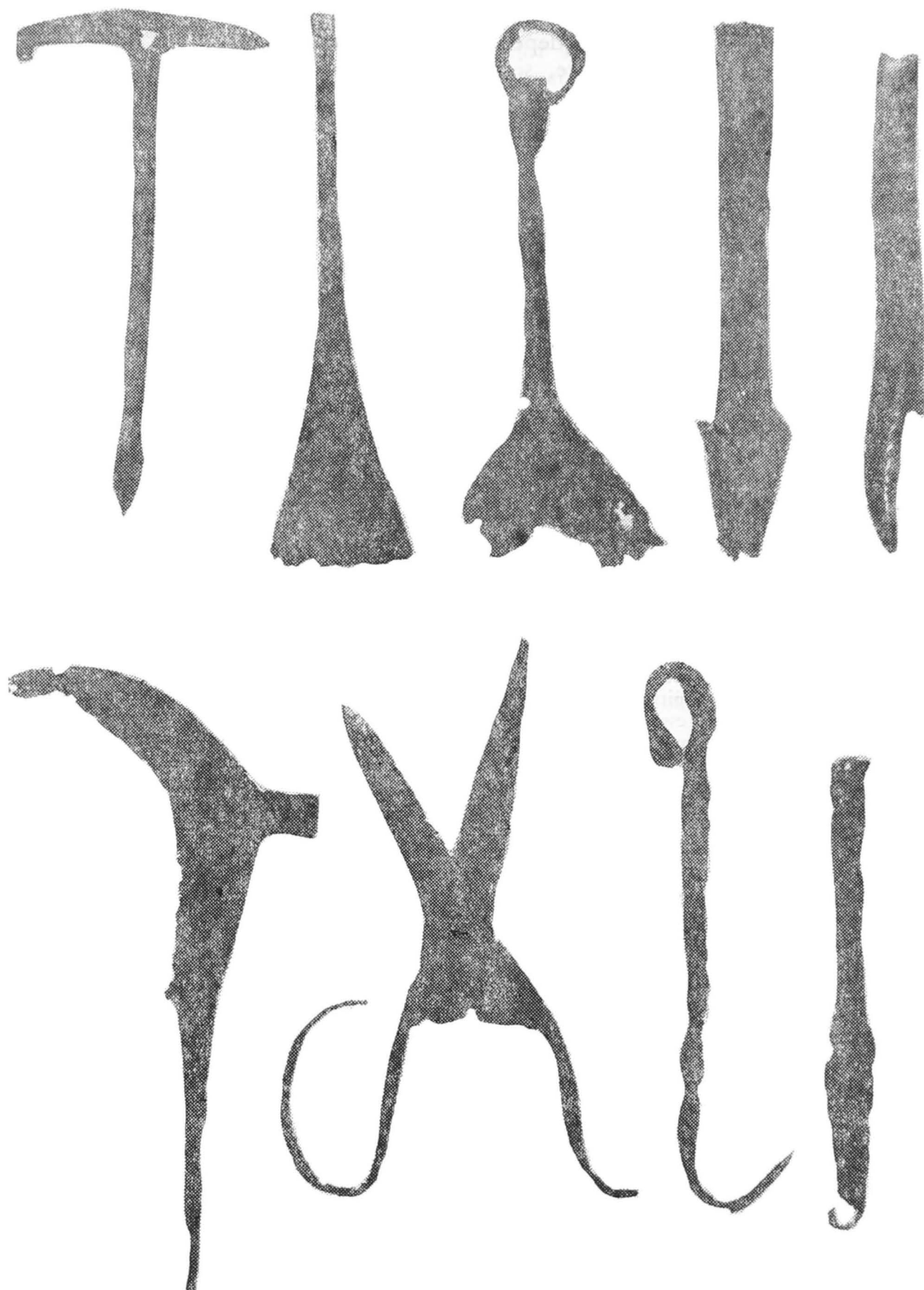
Pl. I, Unelte din fier descoperite la Măicănești (1, 3—4, 6—7, 9) și Mănești (2, 8); undrea din os de la Măicănești (5).