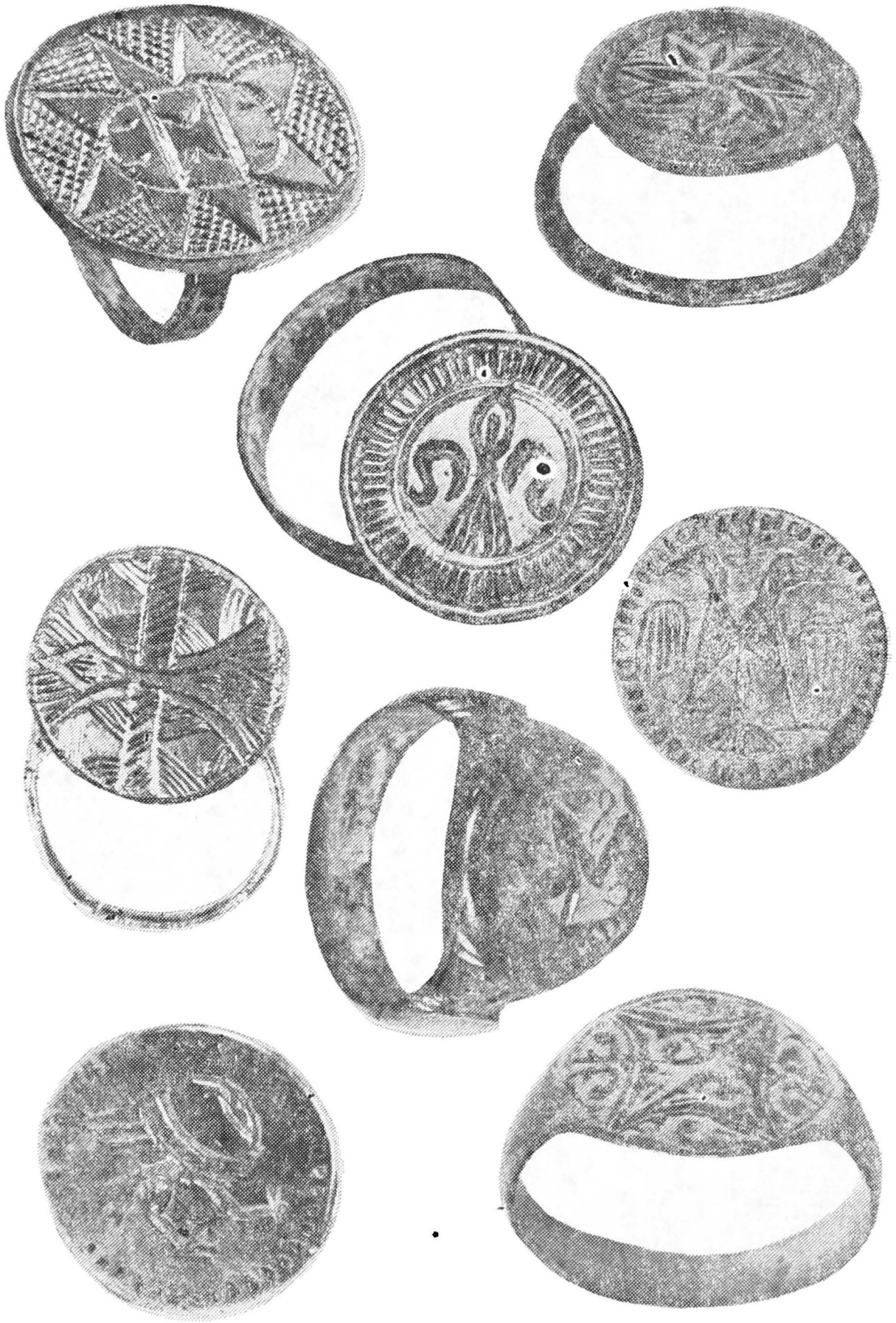
Pl. IV, Inele de argint din secolele XIV—XV descoperite în necropola 2 a satului Mănești.