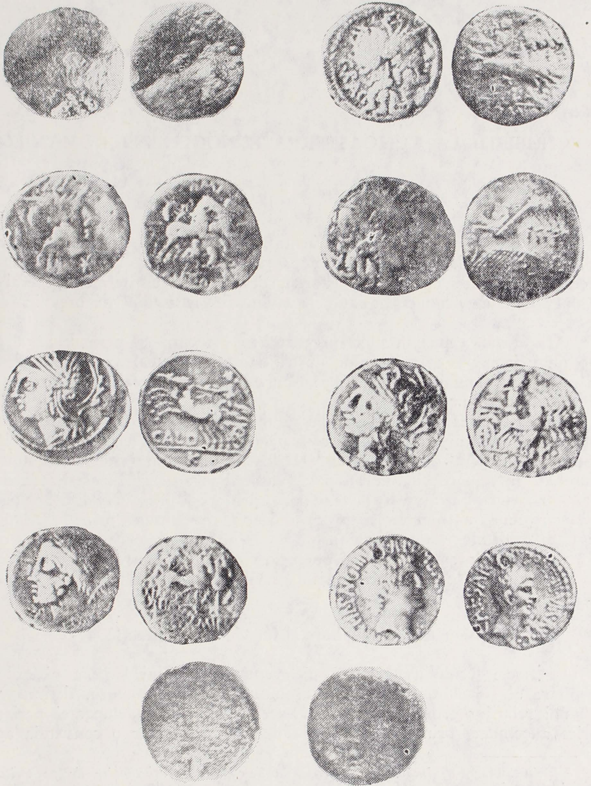
Pl. IV, 31, Monedă geto-dacică. 32—38, Denari romani republicani, 39, Monedă grecească nedeterminată.